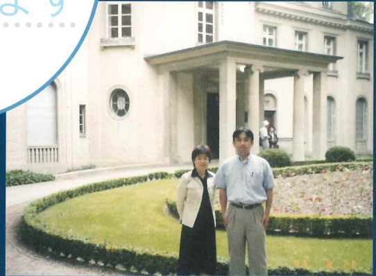
ホロコーストを決めたヴァンゼー会議記念教育館

●薬害肝炎九州訴訟にはたくさんの方々が支援の活動をしています。C型肝炎に苦しむ患者さんのために、真摯に、そして、とても元気に活動しています。「私が大学生のころはどうだっただろうか?」時々そう思わずにはいられません。 学生さんの中には、将来弁護士を目指している学生さんも少なくありません。彼らの先輩として恥ずかしくないように、私も張り切る毎日です。