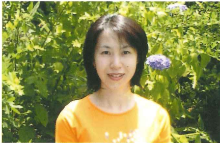
入江 (稲村弁護士担当)