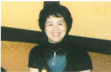
行田 (徳田弁護士担当)